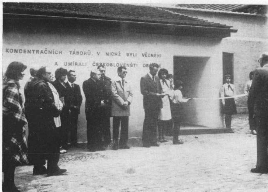
Otevření pamětní síně na IV. dvoře Malé pevnosti 7. 10. 1980