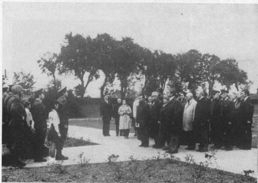
Položení věnců na Národním hřbitově v Terezíně v den zahájení symposia