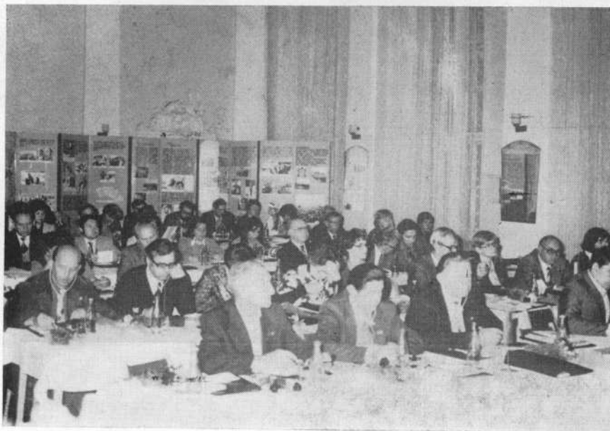
Záběr z jednání konference (Posádkový dům armády v Terezíně)